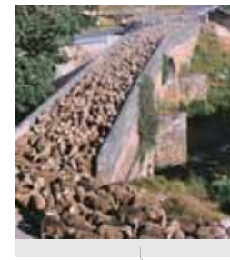
Ganadería trashumante en Extremadura