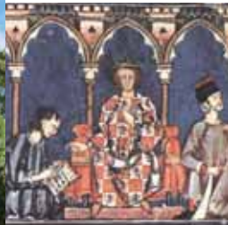
Alfonso X el Sabio

Los visigodos ya disponían una ley sobre el tránsito del ganado que inspiró a Alfonso X El Sabio al crear el Honrado Concejo de la Mesta, unas asambleas de pastores y ganaderos amparadas por el monarca. La Mesta llegó a tener mucho poder y los pastores grandes privilegios como derecho de paso y pastoreo, exención fiscal y judicial. El ocaso de la Mesta se sitúa en el siglo XIX cuando la merina española perdió su monopolio y la agricultura ganó terreno a la trashumancia.