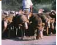
Los carneros encabezaban el rebaño.

Las faenas del pastor durante la trashumancia eran múltiples, desde la atención a los corderos que nacían en el camino hasta curar las heridas de los animales. Con la jara entablillaban las patas del ganado y de los tallos del torvisco extraían una correa para castrar a algunos machos. También elaboraban de forma artesanal objetos de uso cotidiano. Con el corcho de los alcornokes fabricaban recipientes para la sal que necesitaba el ganado, fiambresas para mantener caliente la comida, tapas para los cántaros y asientos bajos. Enfermedades, partos, heridas, alimentación, etc., el conocimiento de los pastores era amplio y aprendían sobre la marcha.