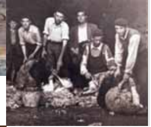
Esquileo en Arroba de los Montes. La primavera era la temporada idónea.

Las migas de pastor era el plato de la mañana. Queso con pan a mediodía y una sopa con carne por la noche completaban la dieta diaria.