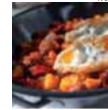
Tijeras de esquilador