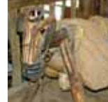
El burro, el medio de transporte de la intendencia.

Collar de perro contra ataques de lobos. El mastín guardaba el rebaño por la noche y el perro pastor lo guiaba durante el día.